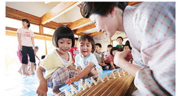
▲過去のイベントより