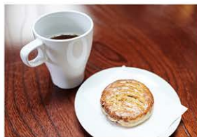
こだわりのお茶菓子

アーティストのコラージュモンスター「みっけ」がプロデュースする、画廊コンサート。「観て聴いて楽しむ」「このマッチングは、今だけ。」をコンセプトに、普段交わることのない、新進美術家による作品の展示と質の高い音楽を融合させ、皆様へご紹介します。展示作品、演奏曲目の解説に加え、コンサート終演後には出演者との茶会を開催し、趣向に沿って選んだ「こだわりのお茶菓子」を皆様にお召し上がりいただきます。また、展示作品は販売（オーダー制作の注文も承ります）も行いますので、併せてお楽しみください。