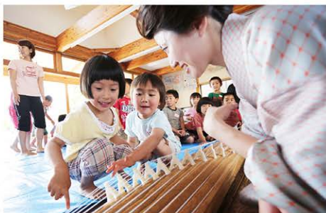
出張ワークショップの様子