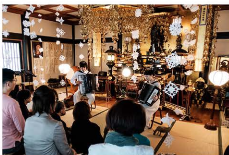
過去の画廊コンサート